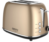
TOASTER 2 SLICES CR 3217