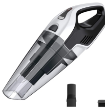
BAGLESS VACUUM CLEANER CR 7046