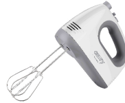
MIXER CR 4220