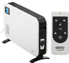
CONVECTION HEATER CR 7724