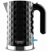
Electric Kettle CR 1169