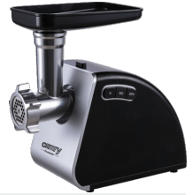
MEAT MINCER CR 4812