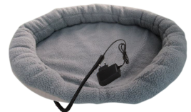
HEATED ANIMAL DEN CR 7431