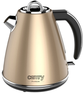
ELECTRIC KETTLE CR 1292