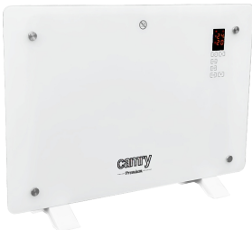
GLASS HEATER CR 7721