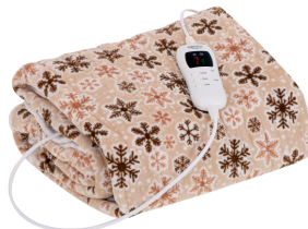
HEATING UNDERBLANKET CR 7430