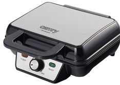
WAFFLE MAKER CR 3046