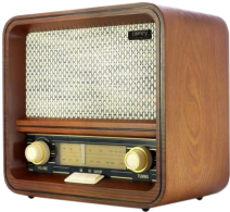
RETRO RADIO CR 1188