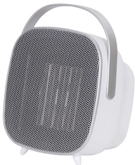
CERAMIC FAN HEATER CR 7732