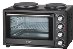
Electric Oven With HOB AD 6020