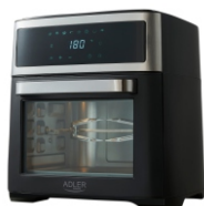
AIR FRYER OVEN AD 6309