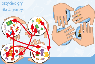
Początkowe rozłożenie kart: przykład gry dla 4 graczy.