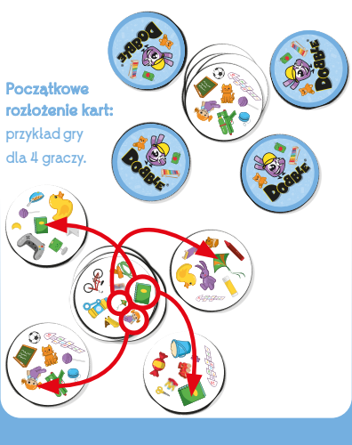
Początkowe rozłożenie kart: przykład gry dla 4 graczy.