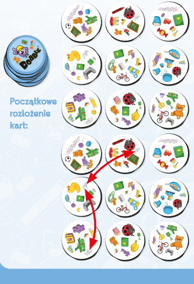
Początkowe rozłożenie kart: