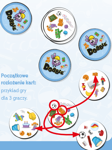
Początkowe rozłożenie kart: przykład gry dla 3 graczy.

4) Jak wygrać? Zwycięża gracz, który zdobył najwięcej kart.